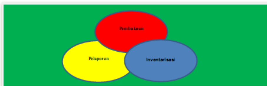
Gambar 1. Proses Penatausahaan Barang Milik Negara

Penatausahaan Barang Milik Negara bertujuan untuk mewujudkan tertib administrasi dan mendukung tertib pengelolaan Barang Milik Negara yang meliputi penatausahaan pada Kuasa Pengguna Barang/Pengguna Barang serta Pengelola Barang sebagaimana diatur dalam Peraturan Menteri Keuangan Nomor: 181/PMK.06/2016 tentang Penatausahaan Barang Milik Negara.